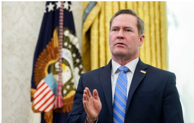
Фото: посол США в ООН Майк Волц

Обирайте перевірене - додайте РБК-Україна до улюблених джерел у Google