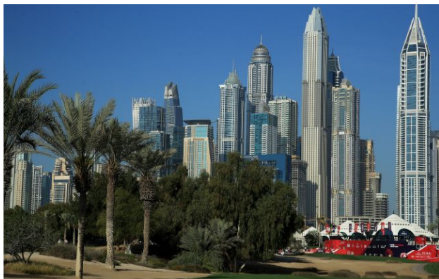
Фото: війна може завдати серйозної шкоди економіці ОАЕ

Представники ОАЕ почали переговори зі США про отримання фінансової підтримки на випадок, якщо війна з Іраном призведе до глибшої кризи в країні, і якщо конфлікт на Близькому Сході затягнеться.