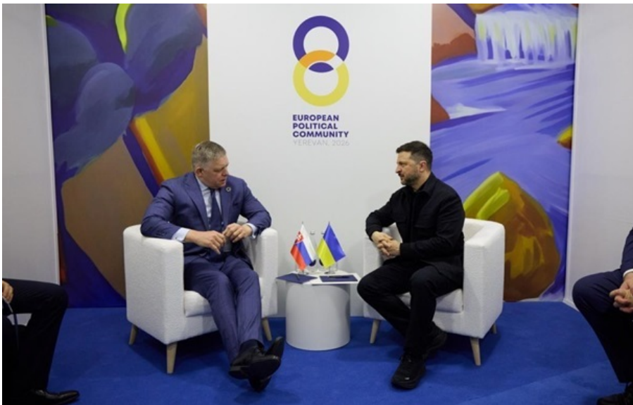
Зеленський провів зустріч з Фіцо

Наразі дипломати визначають місце проведення зустрічі - у Братиславі або Києві. У ній візьмуть участь усі міністри.