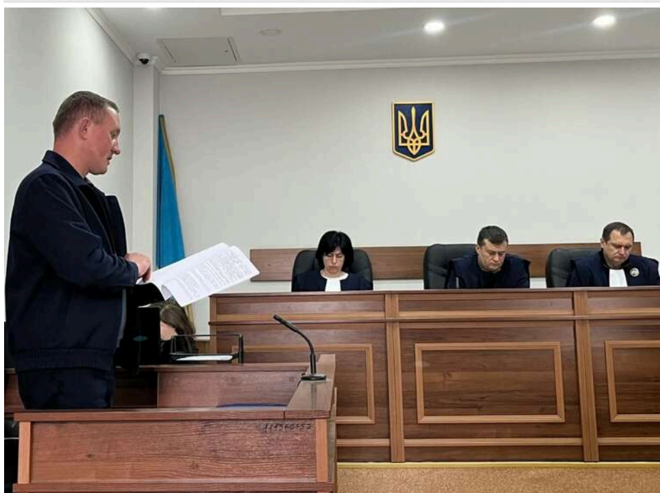
«Пів відра картоплі та ковток пива»: мешканець Київщини отримав 5 років за колабораціонізм, рятуючи сім'ю від розстрілу