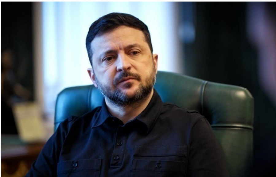
Президент України Володимир Зеленський

Президент зазначив, що не було жодного офіційного звернення до України щодо модальності припинення бойових дій, про яке заявляється в російських соціальних мережах.