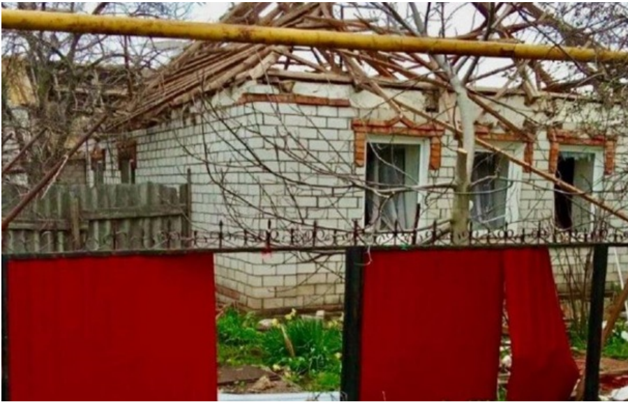
Наслідки обстрілу Дніпропетровщини

Пошкоджена інфраструктура, комунальне підприємство, магазин, приватні будинки та автомобіль.