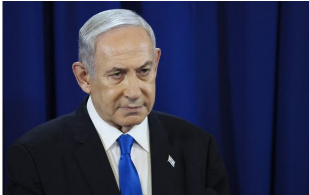
Фото: Біньямін Нетаньягу

Зусилля США та Ізраїлю проти Ірану ще не завершені, а будь-який день може принести нові події.