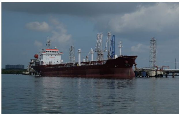
Фото: нафтовий танкер

Обирайте перевірене - додайте РБК-Україна до улюблених джерел у Google