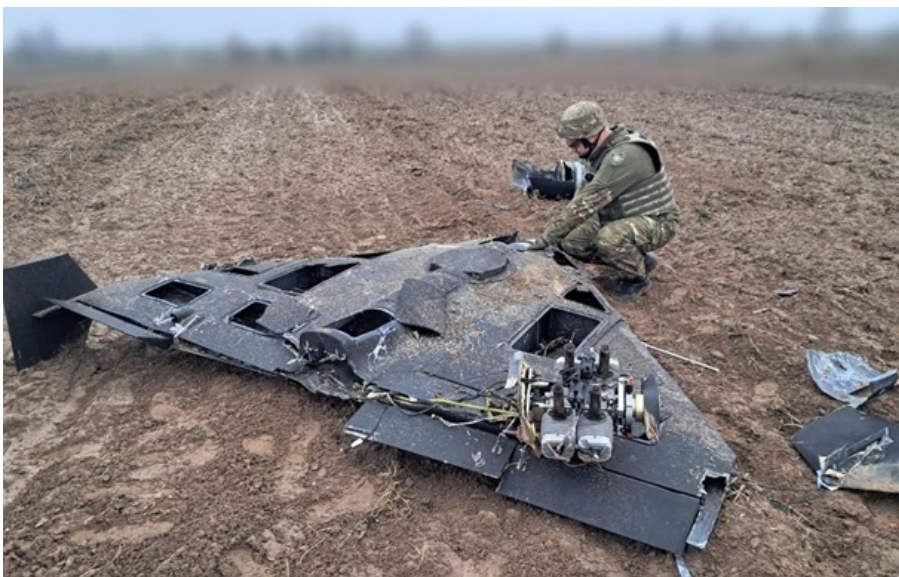
Сили ППО знищили 114 дронів