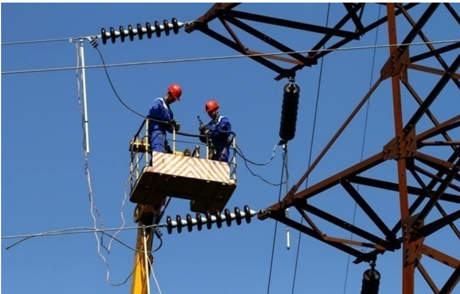
(ілюстративне фото) Місто Славутич знеструмлене

Унаслідок російської атаки Славутич тимчасово залишився без світла - це близько 21 тисячі абонентів.