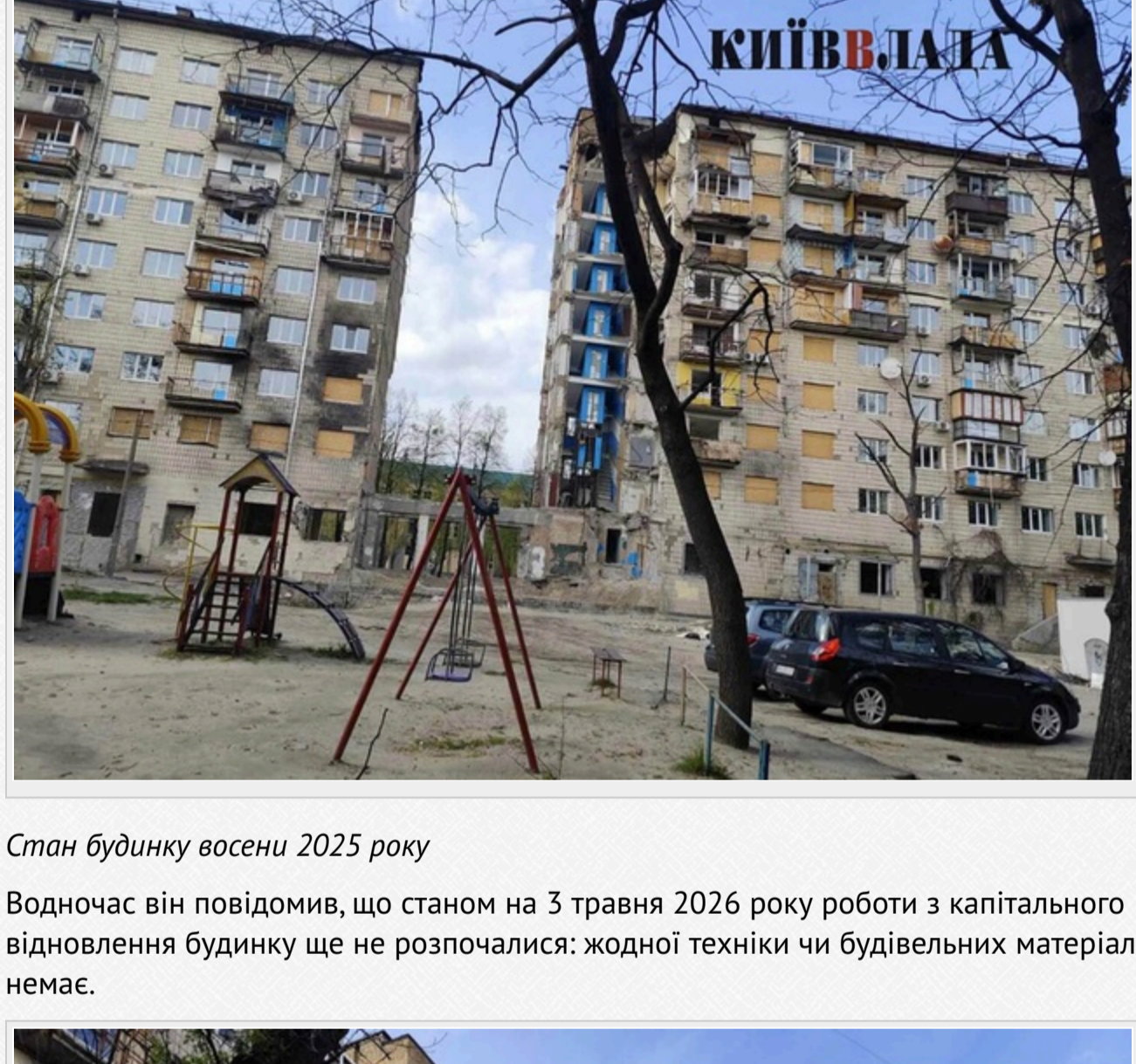
Стан будинку восени 2025 року

Водночас він повідомив, що станом на 3 травня 2026 року роботи з капітального відновлення будинку ще не розпочалися: жодної техніки чи будівельних матеріалів немає.