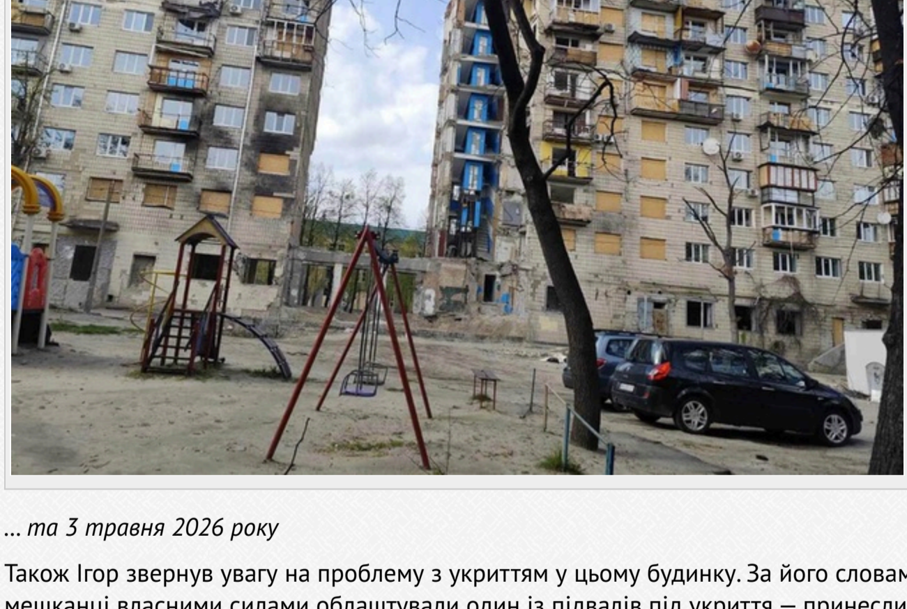
...та 3 травня 2026 року