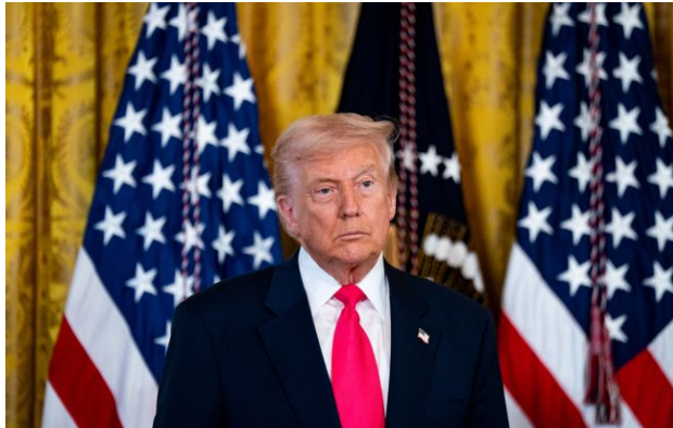
Фото: Дональд Трамп (Gettyimages)

Обирайте перевірене - додайте РБК-Україна до улюблених джерел у Google