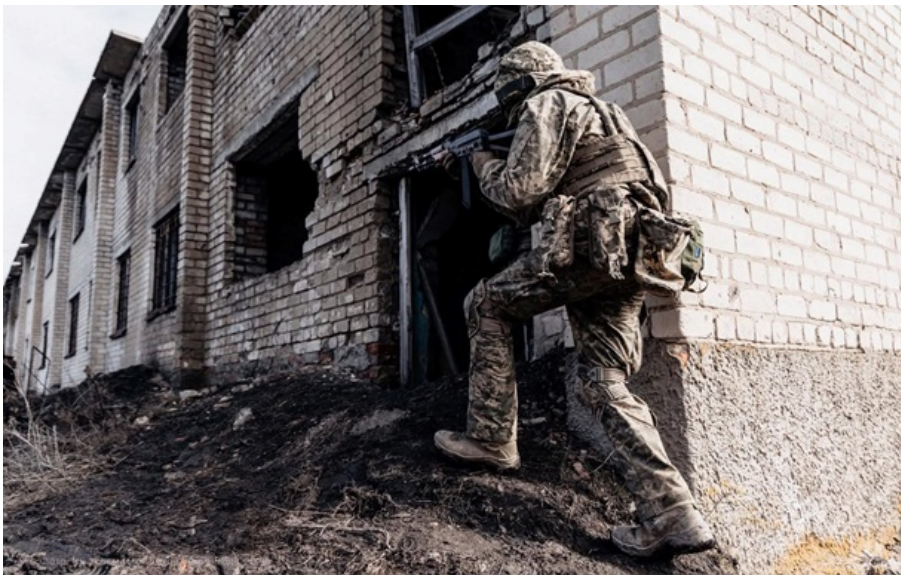
ЗСУ продовжують нищити ворога