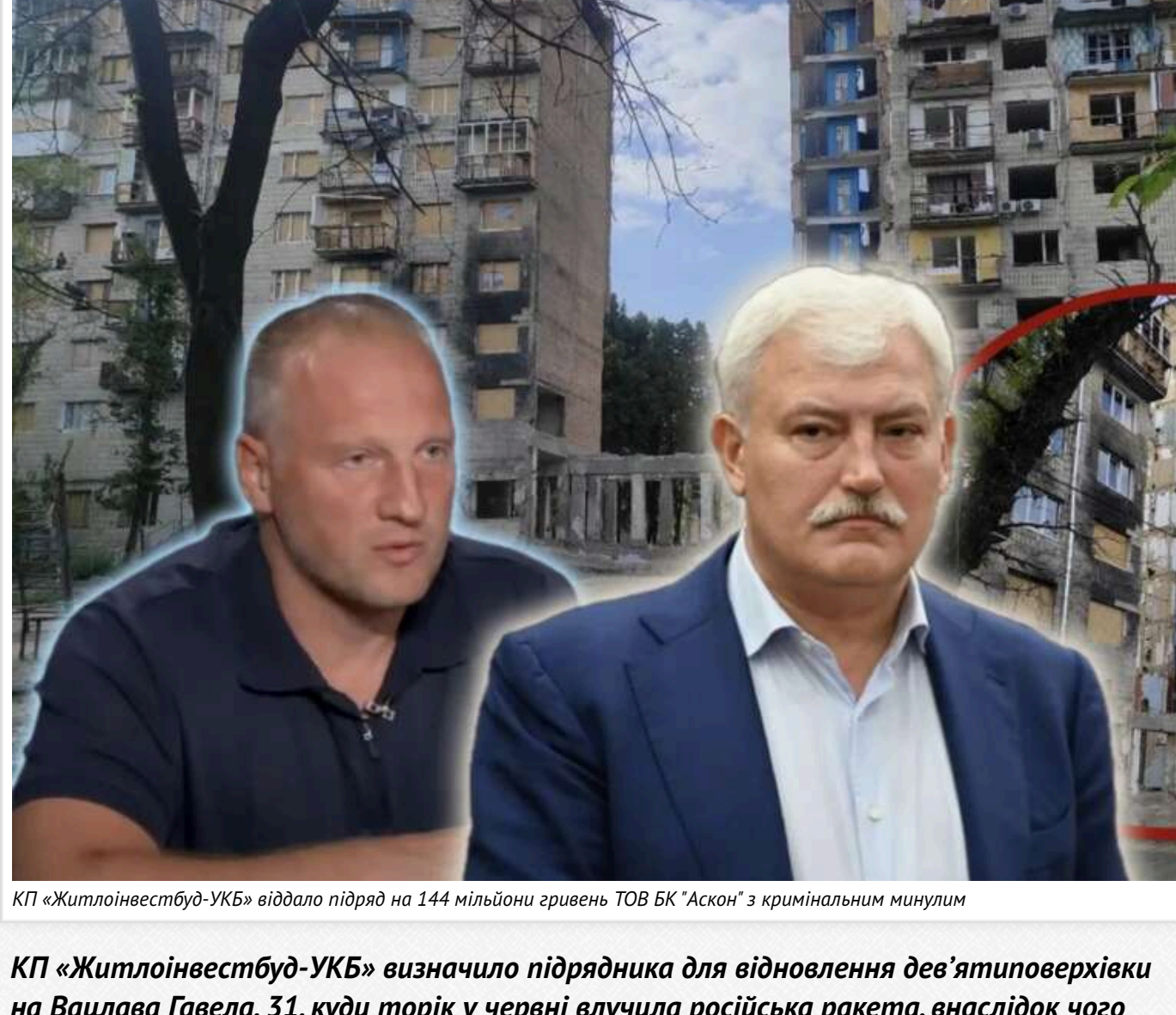
КП «Житлоінвестбуд-УКБ» віддало підряд на 144 мільйони гривень ТОВ БК "Аскон" з кримінальним минулим

КП «Житлоінвестбуд-УКБ» визначило підрядника для відновлення дев'ятиповерхівки на Вацлава Гавела, 31, куди торік у червні влучила російська ракета, внаслідок чого загинуло 23 мирні мешканці. Ним стало сполучне ТОВ "БК "Аскон", яке зважало про залучення до процесу сестри субпідрядників. Заплановано відновлення об'єкту на 144,5 млн гривень, із яких наразі гарантовано лише близько 12%. Завершити відбудову планують до жовтня 2027 року — але виключно за умови своєчасного фінансування.