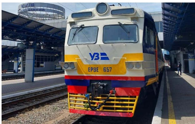
Фото: Київська кільцева електричка

Обирайте перевірене - додайте РБК-Україна до улюблених джерел у Google