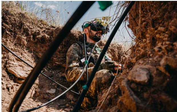
Фото: український військовий оператор дрона на позиції

Обирайте перевірене - додайте РБК-Україна до улюблених джерел у Google