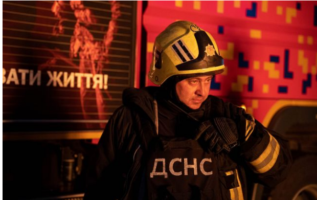
Фото: після атаки на місце події вирушили представники адміністрації та всі відповідні служби (facebook.com/DSNS.GOV.UA/)

Російські окупанти пізно ввечері, 19 квітня, намагалися атакувати Миколаїв дронами. Внаслідок атаки щонайменше одного безпілотної к місті вже зафіксовані пошкодження.