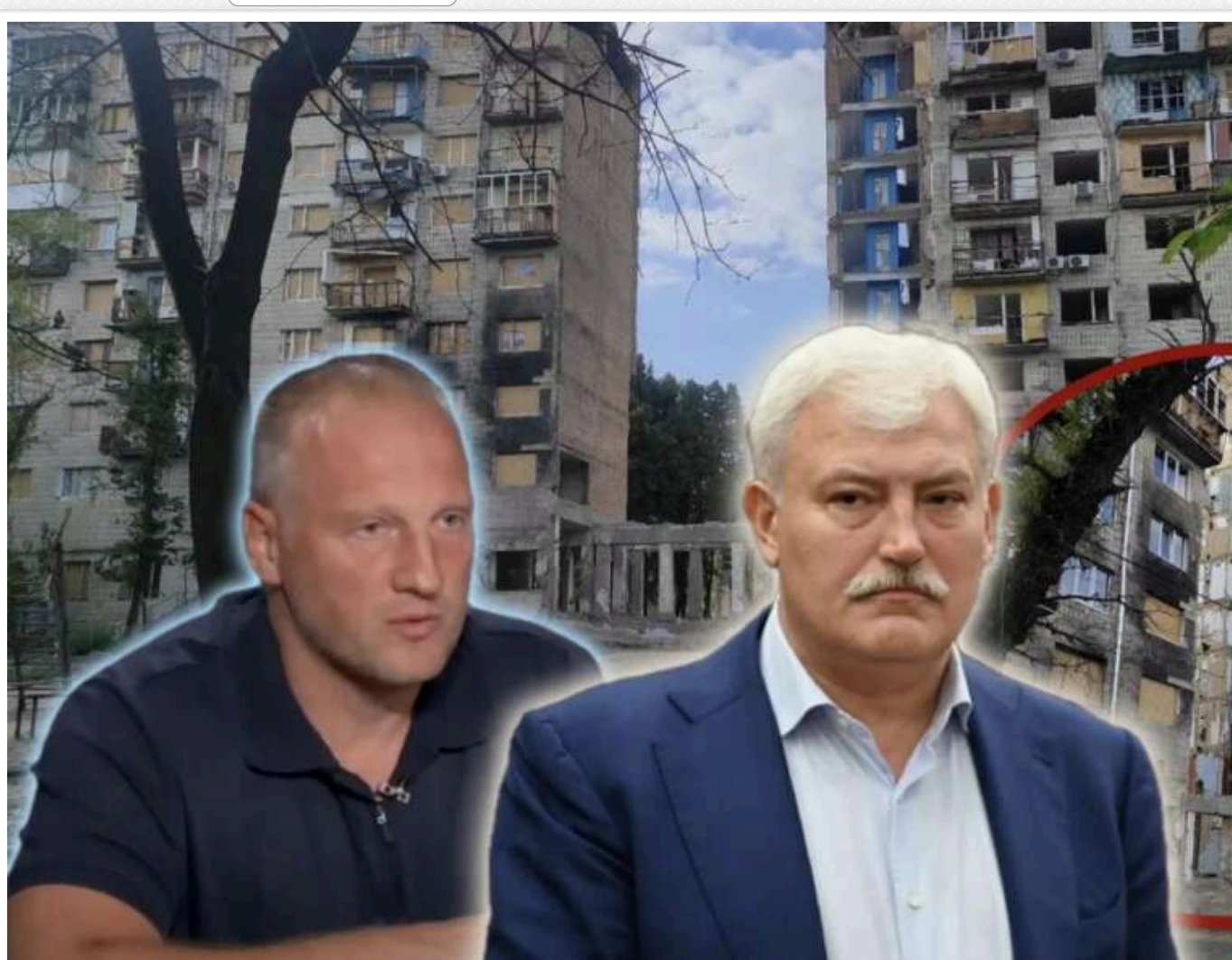
КП «Житлоінвестбуд-УКБ» віддало підряд на 144 мільйони гривень ТОВ БК "Аскон" з кримінальним минулим

КП «Житлоінвестбуд-УКБ» визначило підрядника для відновлення дев'ятиповерхівки на Вулкова Гавела, 31, куди торік у червні влучила російська ракета, внаслідок чого загинули 23 мирні мешканці. Ним стало столичне ТОВ «БК "Аскон", яке заявило про завершення до процесу семи субпідрядників. Зазнає вагати відновлення оцінено у 144,5 млн гривень, із яких наразі вартімовано лише близько 12%. Завершити відбудову планується до жовтня 2027 року – але виключно за умови своєчасного фінансування.