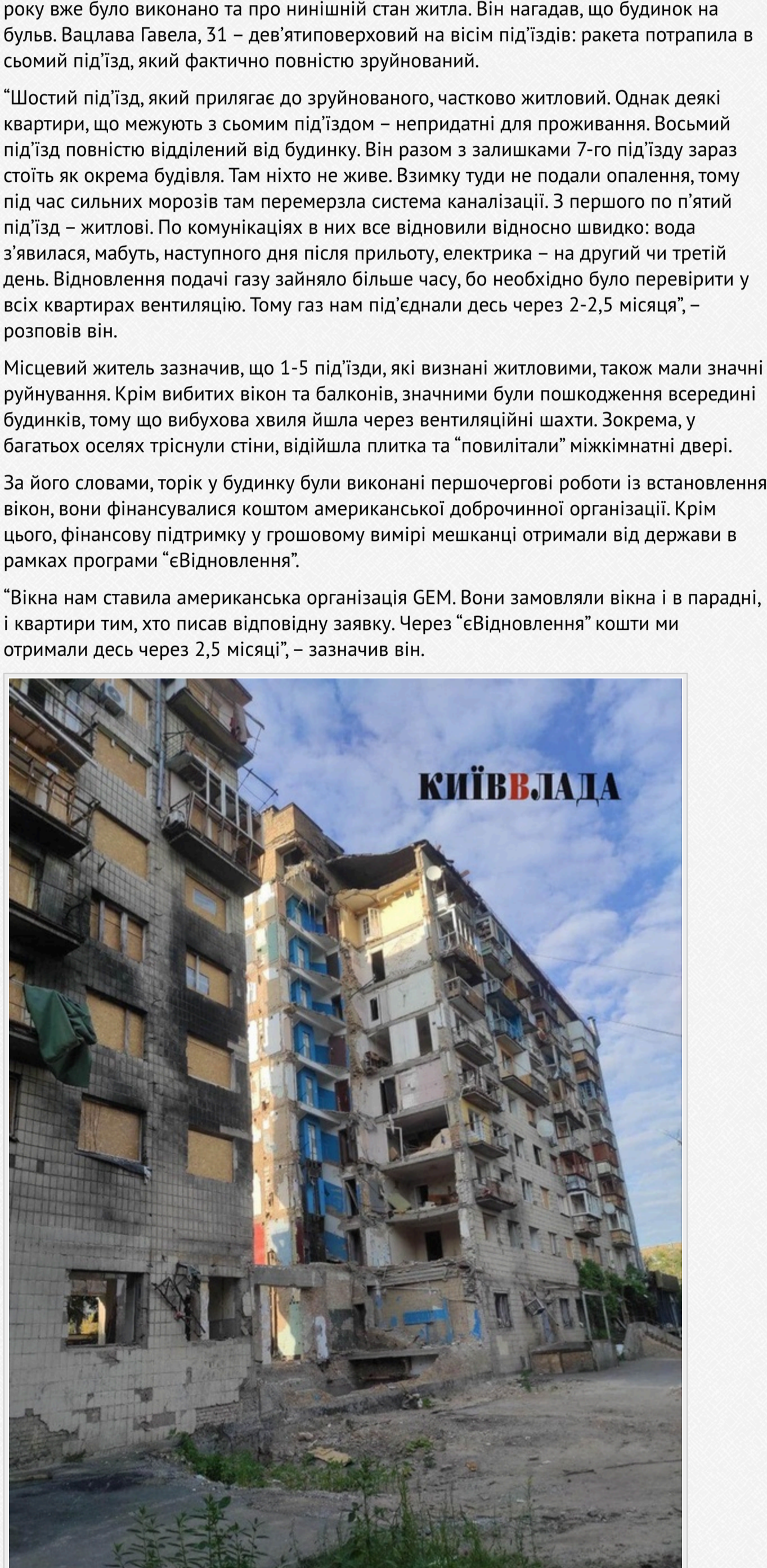
Стан будинку восени 2025 року

"Вікна нам ставила американська організація GEM. Вони замовляли вікна і в парадні, і квартири тим, хто писав відповідну заявку. Через "Відновлення" кошти ми отримали десь через 2,5 місяці", – зазначив він.