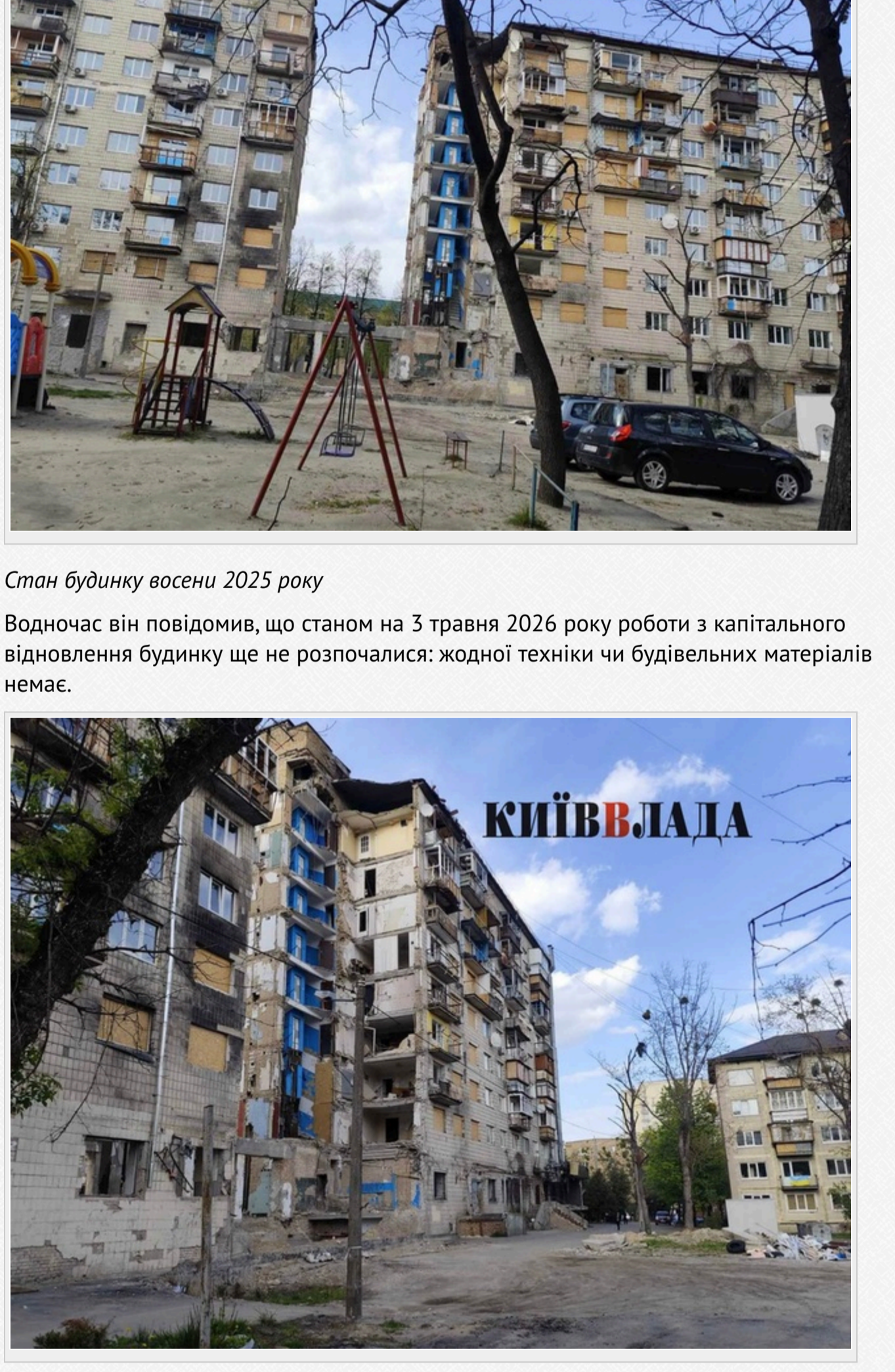
...та 3 травня 2026 року

Водночас він повідомив, що станом на 3 травня 2026 року роботи з капітального відновлення будинку ще не розпочалися: жодної техніки чи будівельних матеріалів немає.