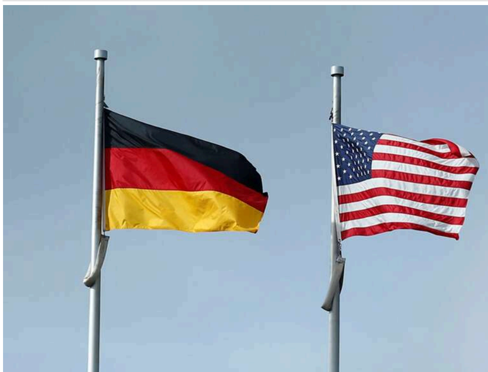
Tomahawk та установки Турпоп для Бундесверу: Берлін готує мільярдну угоду з Вашингтоном на тлі загрози з боку РФ

Німеччина поновила перемовини з США про придбання крилатих ракет Tomahawk через занепокоєння, що Європа залишиться без адекватних засобів стримування Росії.