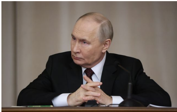
Фото: Володимир Путін, російський диктатор

Обирайте перевірене - додайте РБК-Україна до улюблених джерел у Google