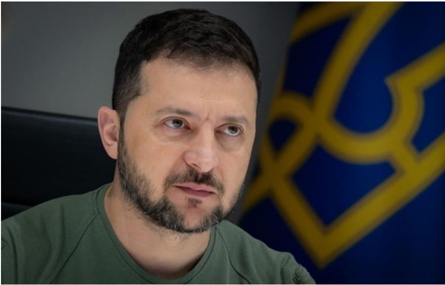
Президент України Володимир Зеленський

Зеленський додав, що "це війна Росії проти України", тому важливо, щоб українська сторона знала, про що домовляються США і РФ.