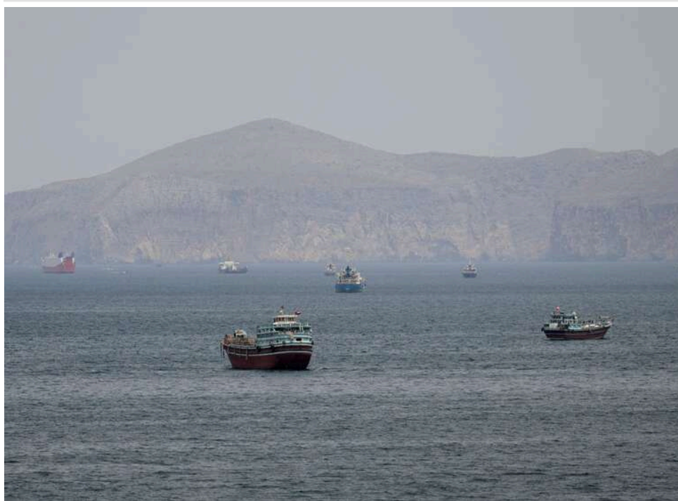
Операція «Проект Свобода»: Пентагон заявив про прохід есмінців та перших цивільних суден через Ормузьку протоку

У Пентагоні повідомили, що військові кораблі США вже подолали Ормузьку протоку, щоб розпочати евакуацію застряглих торговельних суден, як раніше оголосив Трамп.