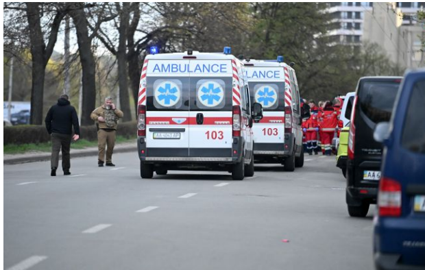
Фото: карети швидкої допомоги та медики на місці події (Getty Images)

Обирайте перевірене - додайте РБК-Україна до улюблених джерел у Google