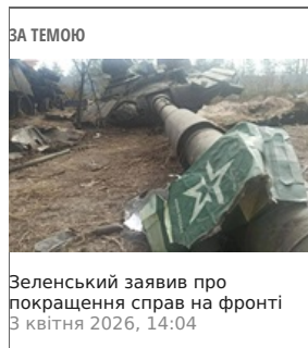
Зеленський заявив про покращення справ на фронті 3 квітня 2026, 14:04

"Це на 240% більше, ніж за попередні 3 місяці, і майже напевно саме тому ми спостерігаємо більше успіхів від українських далекобійних ударів", - зазначив аналітик.