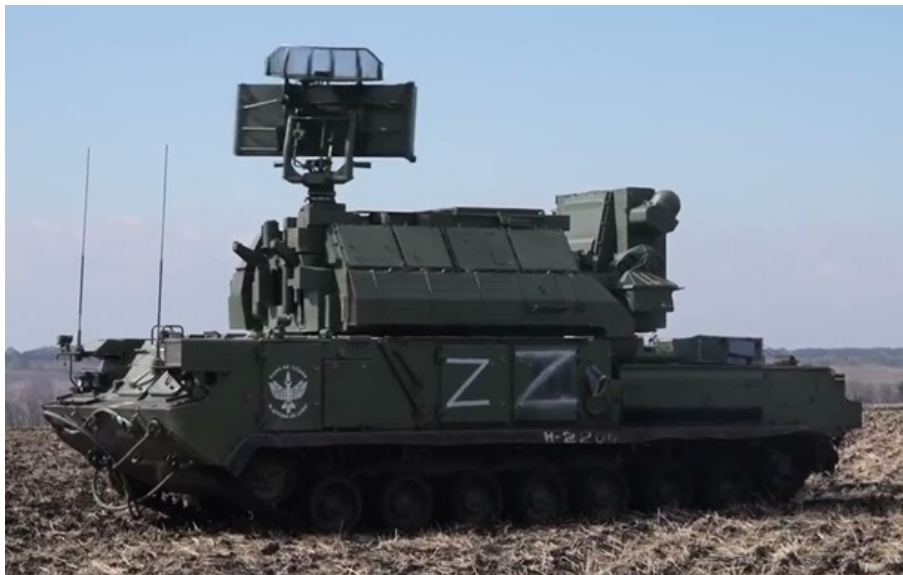
Фото: Скриншот відео (ілюстративне фото) Російський ЗРК Тор на гусеничній базі

Суттєві втрати систем ППО пояснюють, чому українські дрони дедалі частіше проникають у глибину російського тилу.