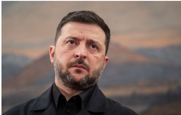
Фото: Володимир Зеленський

Обирайте перевірене - додайте РБК-Україна до улюблених джерел у Google