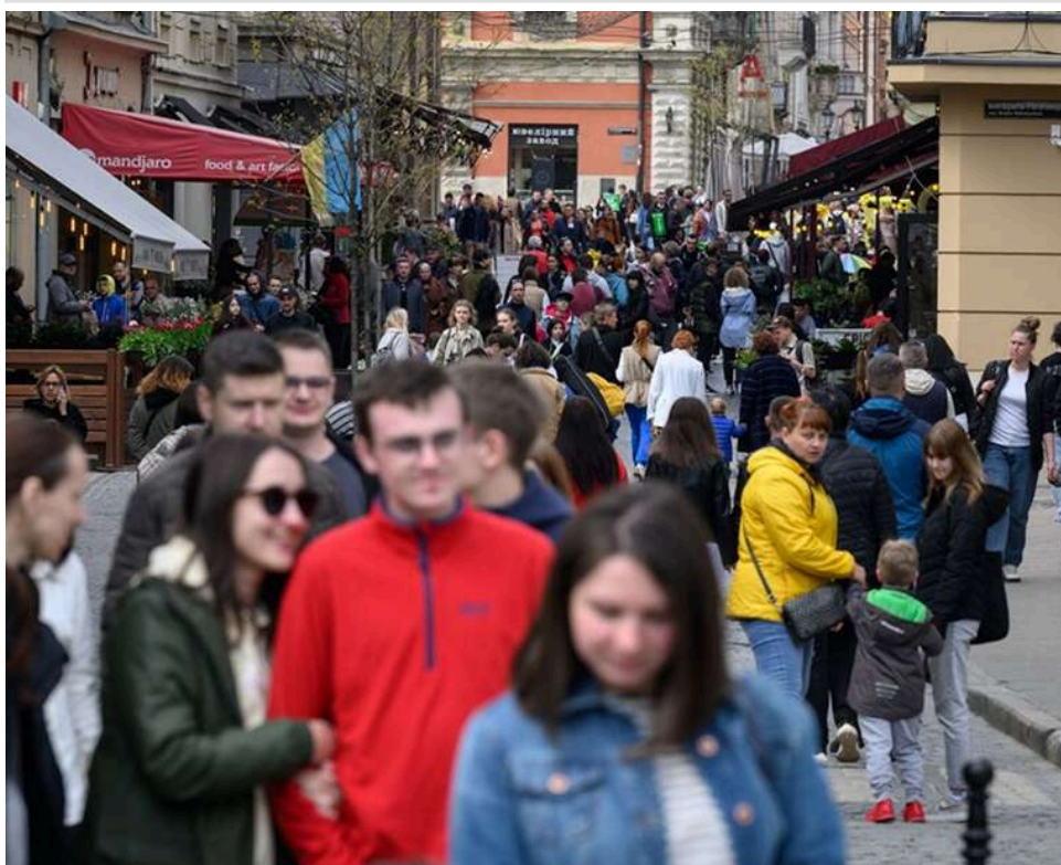
Демографічний удар: населення на підконтрольних територіях України скоротилося до 22–25 мільйонів осіб

На території, підконтрольній Києву, населення України наразі оцінюється приблизно у 22-25 млн осіб. Про це повідомив міністр соціальної політики Денис Улютин, якого цитують ЗМІ.