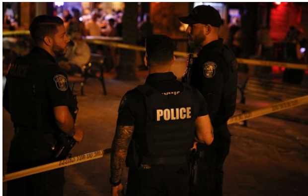
Фото: американські правоохоронці (Getty Images)

У США в неділю сталась масова стрілянина у штаті Луїзіана, в результаті чого восьмеро дітей віком до 14 років загинули, а щонайменше 10 осіб отримали поранення.