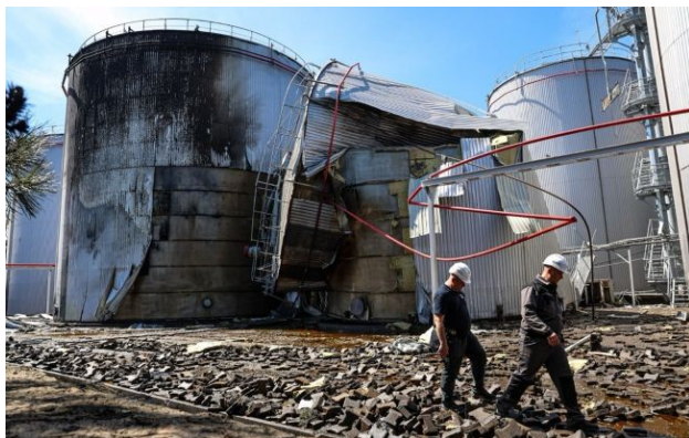
Росіяни атакували олійний термінал компанії "Кернел" (прес-служба)

Обирайте перевірене - додайте РБК-Україна до улюблених джерел у Google