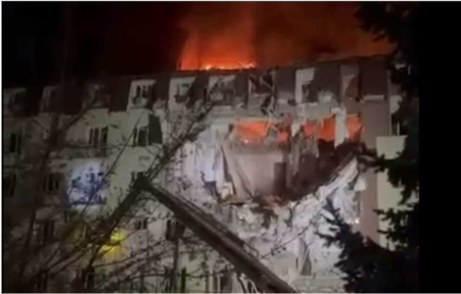
В одному з районів Одеси зафіксовано влучання у багатоповерхівку

Вже відомо про п'ятьох постраждалих, під завалами пошкоджені багатоповерхівки можуть перебувати люди.