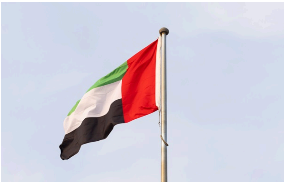
В ОАЕ підтвердили атаку з боку Ірану

Міністерство оборони підтвердило, що звуки, які чули в різних частинах країни, є результатом успішного перехоплення повітряних загроз.