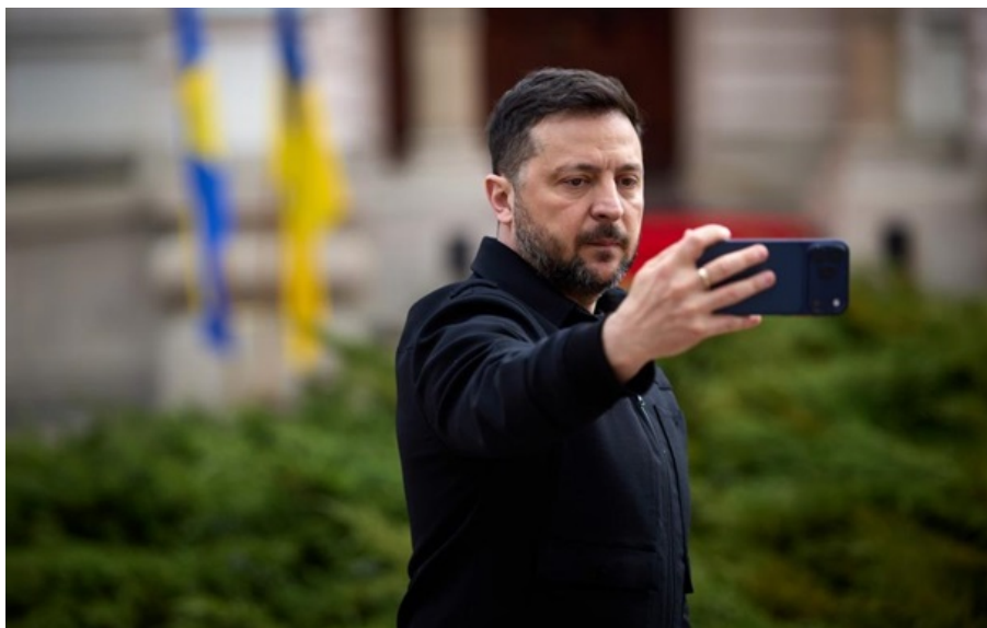
Володимир Зеленський братиме участь у зустрічі по Ормузу

Абсолютно всі в світі бачать, що безпека на морі – це глобальна цінність, а не просто чиясь окрема проблема, зазначив глава держави.