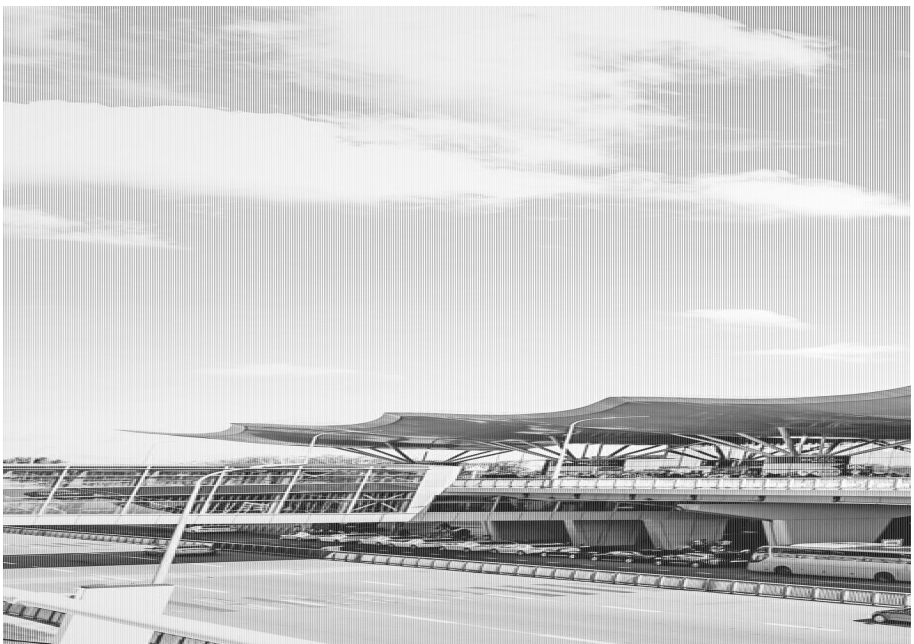
Термінал D аеропорту "Бориспіль". Архівне фото

На підставі цих фактів Національне антикорупційне бюро вважало, що пан Зубко міг "незаконно використати майно підприємства", в результаті чого держава недоотримала доходу на понад 30 млн гривень. У клопотанні НАБУ до Вищого антикорупційного суду прямо сказано, що детективи підозрювали чиновника у вчиненні злочину, передбаченого ч. 2 ст. 364 Кримінального кодексу (зловживання службовим становищем, що призвело до тяжких наслідків), який