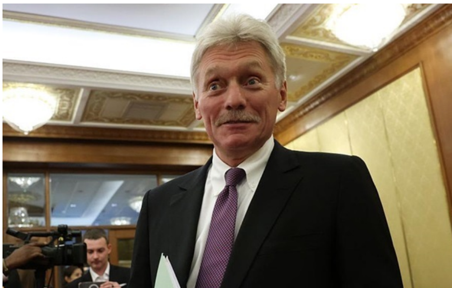
Дмитрий Песков заверил, что никакого ультиматума нет

В настоящее время нет никаких сроков вывода украинских войск из Донбасса, но «лучше было сделать это вчера», отметил Дмитрий Песков.