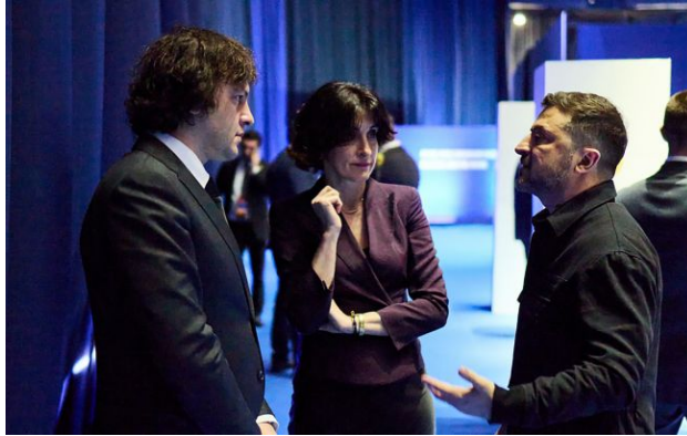
Фото: Володимир Зеленський та Іраклій Кобахідзе ( https://t.me/V_Zelenskiy_official )

Обирайте перевірене - додайте РБК-Україна до улюблених джерел у Google