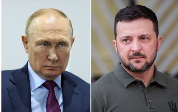
Фото: російський диктатор Володимир Путін та президент України Володимир Зеленський (колаж РБК-Україна)

Обирайте перевірене - додайте РБК-Україна до улюблених джерел у Google