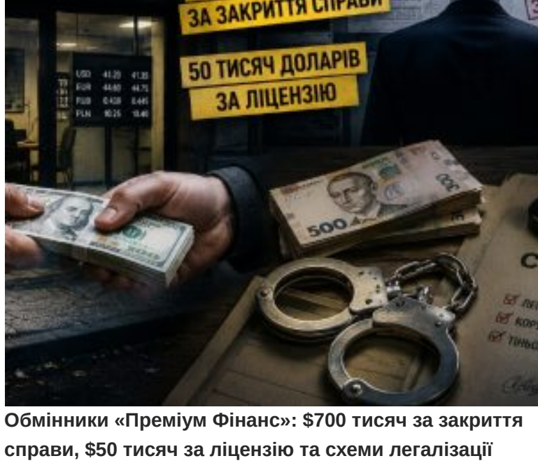
Обмінник «Преміум Фінанс»: $700 тисяч за закриття справи, $50 тисяч за ліцензію та схеми легалізації коштів