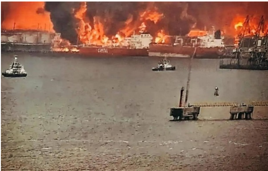
Масштабні пожежі в порту Усть-Луга в Росії

Попри відновлення роботи порту, атаки суттєво вплинули на російську нафтову інфраструктуру.