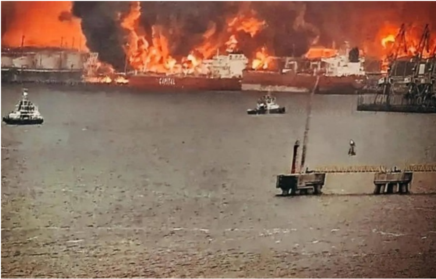
Масштабні пожежі в порту Усть-Луга в Росії

Попри відновлення роботи порту, атаки суттєво вплинули на російську нафтову інфраструктуру.