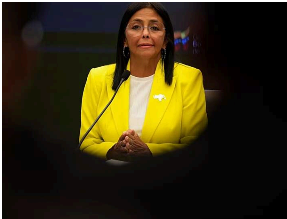
Тіньовий наступ Дельсі Родрігес: як віцепрезидентка Венесуели перебирає контроль над силовим блоком

Дельсі Родрігес посилює вплив у Венесуелі: ЗМІ повідомляють про перебудову влади та кадрові чистки.