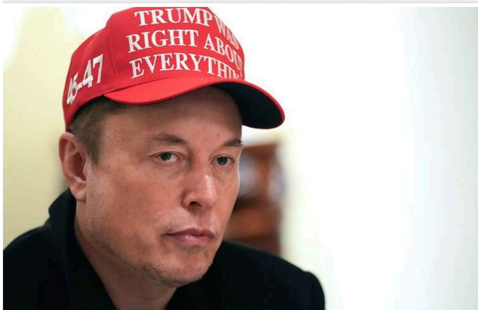
План на 10 трильйонів доларів або нічого: Ілон Маск готується стати найбагатшою людиною в історії людства

Маск написав у X, що план – досягти розміру особистих активів у $10 трлн або нічого.