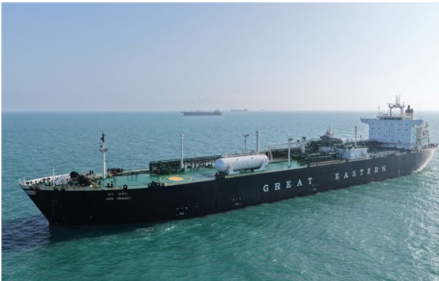
Вже друге пов'язане з Японією судно пройшло через Ормузьку протоку