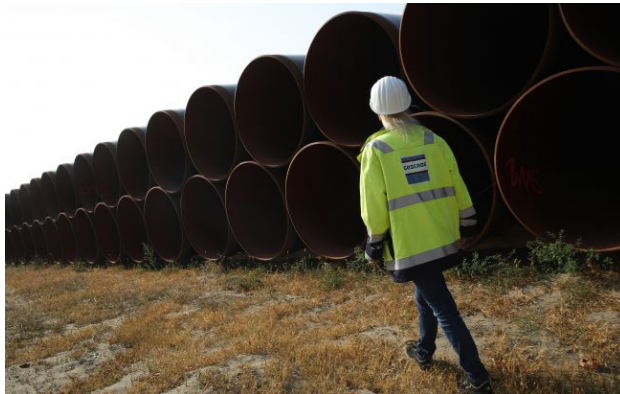
Фото: труби газопроводу "Північний потік"

Обирайте перевірене - додайте РБК-Україна до улюблених джерел у Google