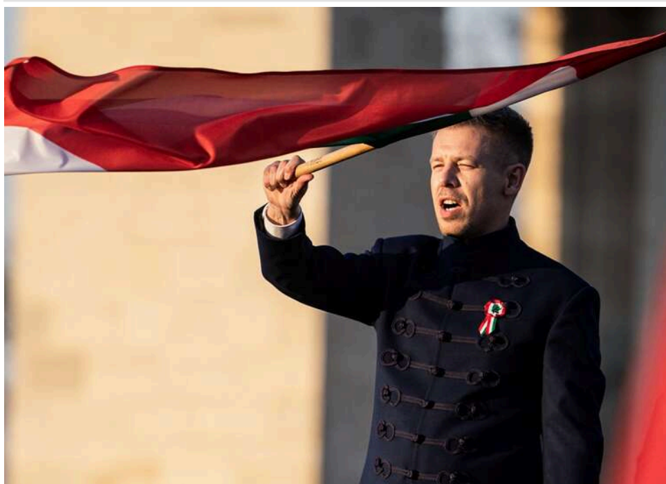
Петер Мадяр заявив про маніпуляції на виборах в Угорщині, попри перемогу «Тиси»

Лідер угорської опозиції Петер Мадяр звинуватив владу в маніпуляціях на парламентських виборах, попри впевнену перемогу своєї партії «Тиса».