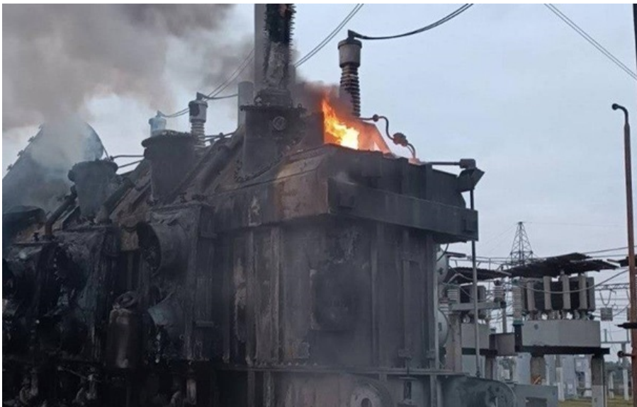
(ілюстративне фото) Росіяни пошкодили енергооб'єкт у Новгород-Сіверському районі на Чернігівщині

Внаслідок нічної ворожої атаки на Чернігівщину пошкоджено енергооб'єкт у Новгород-Сіверському районі.