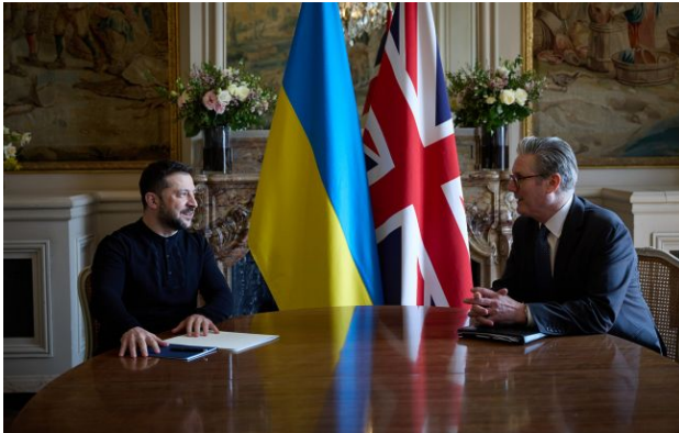
Фото: Кір Стармер і Володимир Зеленський (facebook.com zelenskyy.official)

Обирайте перевірене - додайте РБК-Україна до улюблених джерел у Google