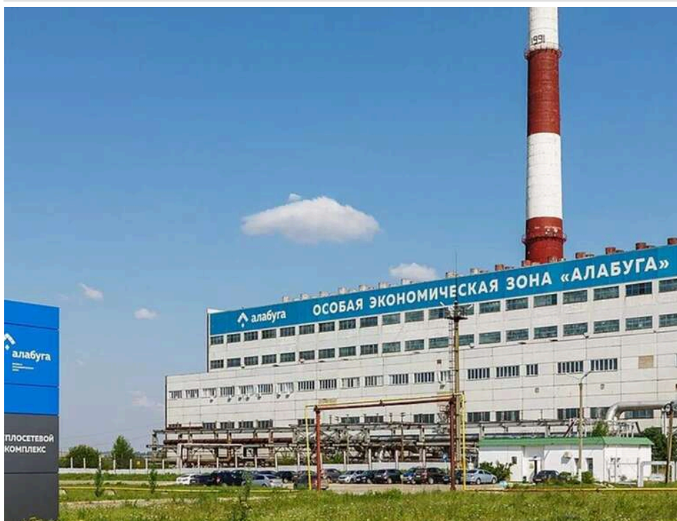
"Панцирі" та вежі ППО: Росія активно розбудовує та захищає центр виробництва безпілотників в "Алабузі"

Площа особової економічної зони «Алабуга», де випускають «герані», за рік зросла приблизно на 340 гектарів.