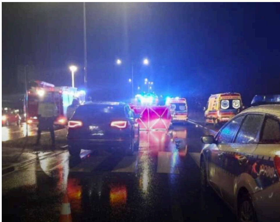
Замість тюрми – електронний браслет: польському бізнесмену, який збив на смерть двох українок, пом'якшили вирок