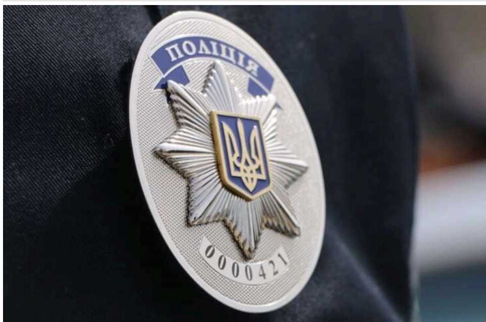
У Полтавській області загинув 17-річний юнак: поліція відкрила справу про вбивство

У Полтавській області правоохоронці розслідують смерть 17-річного юнака, якого виявили без ознак життя. Тіло неповнолітнього знайшли на території приватного будинку.