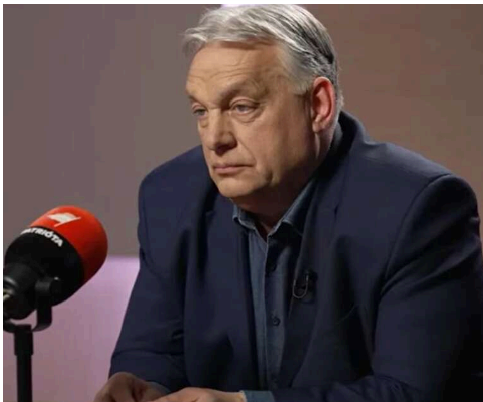
Біль, порожнеча та терапія роботою: Віктор Орбан вперше прокоментував свою поразку на виборах

Прем'єр-міністр Угорщини Віктор Орбан, чия партія нещодавно зазнала поразки на парламентських виборах, заявив, що й надалі очолюватиме «Фідес» в опозиції.