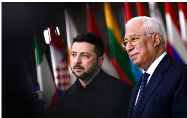
Фото: Володимир Зеленський та Антоніу Кошта

Обирайте перевірене - додайте РБК-Україна до улюблених джерел у Google